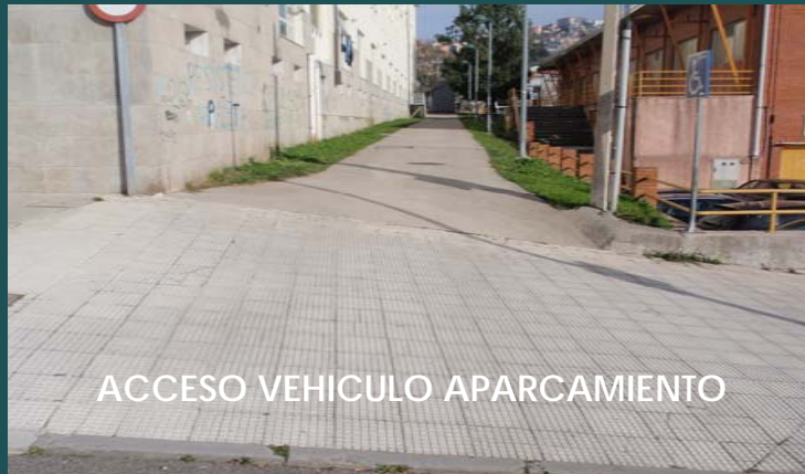
ACCESO VEHICULO APARCAMIENTO