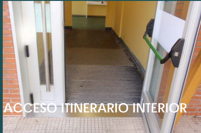
ACCESO ITINERARIO INTERIOR